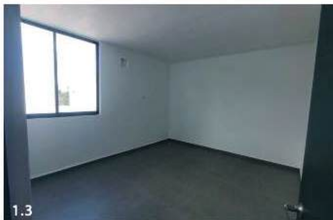
1.1 Escaleras, 1.2 Baño completo planta alta, 1.3 Recámara secundaria, 1.4 Espacio recibidor escaleras planta alta