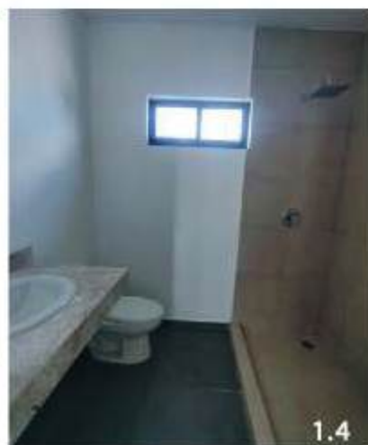
1.1 Recámara principal 1.2 Vista recamara principal y clóset al fondo, 1.3 Clóset vestidor, 1.4 baño completo