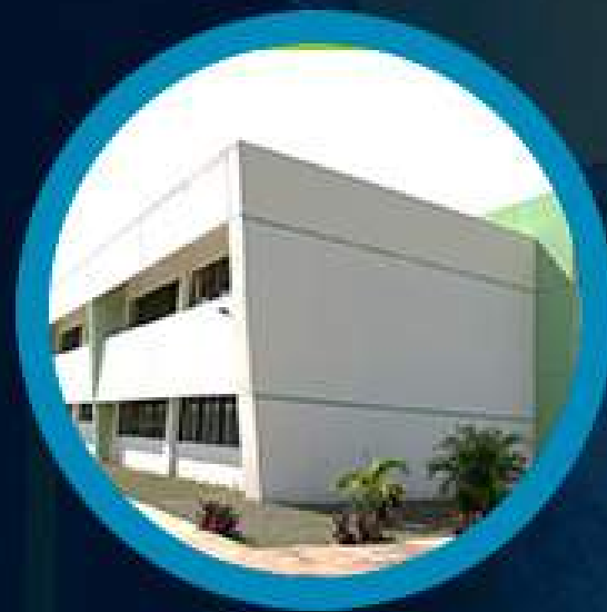
Instituto Tecnológico de Conkal