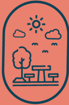
Área de Pic-Nic