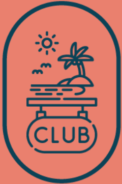
Membresía club de playa