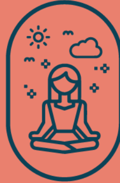
Área de meditación